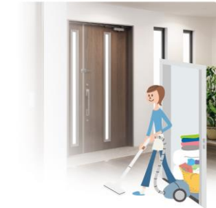
1階から2階の掃除も 部屋を回る手軽さです。

足腰が弱ると2階への移動が たいへんに。エレベーターが あれば平屋感覚で洗濯物や 買い物もラクに運べます。 階段での転倒などの危険も 減らせます。