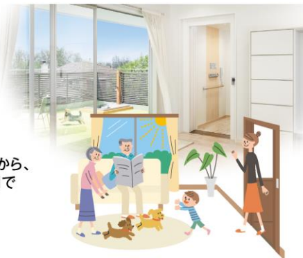
窓も大きく取れるから、 光のあふれる空間で くつろげます。

日当たりや風通しの良い2階はくつろぐのに ふさわしいスペース。集まって食事をしたり、 おしゃべりをして楽しめます。