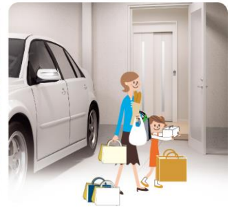
たくさんの買い物も、ガレージから 2階へラクに運べます。