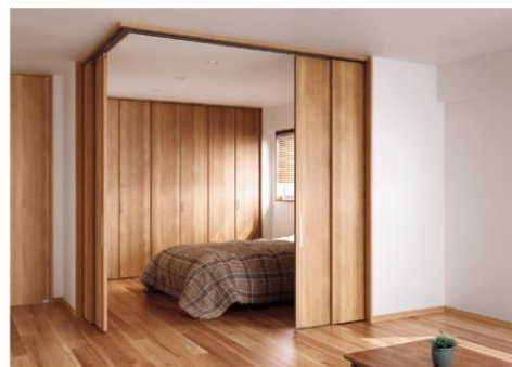
空間が自在に使い、隣りの心配も減らせる