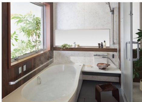
転倒の不安なく入浴をゆったり楽しめる