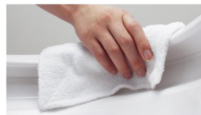
スキマや段差がほとんどないので ふき掃除がラクラク