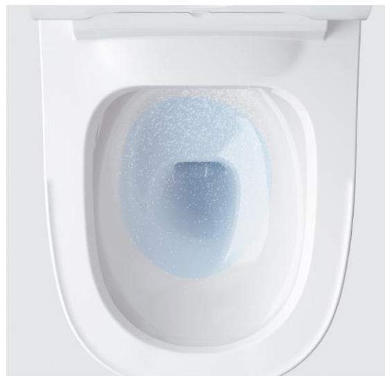
水アカと汚れのつきにくいスゴピカ素材で ツルンとキレイなトイレをキープ