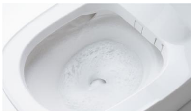
洗剤の泡と勢いのある水流で 流すたびに便器内をしっかりおそうじ

いまどきのトイレは自動で洗浄・汚れをガードし、ニオイもスッキリ。毎日おそうじしなくても、清潔感を保ちます。