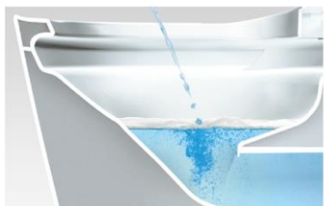
洗剤の泡がクッションになって トビハネを抑えるから床が汚れにくい