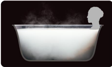
柔らかなお湯は「酸素美泡湯」。ぬるめでも芯からあたたまり、 湯上がり後も湯冷めしにくい。肌の乾燥を防ぎうるおい長続き。

大きな窓は浴室をより広く感じさせ、 くつろぎを増してくれます。 白濁した泡のお湯にゆったり浸れば、 わが家にいることも忘れそうです。